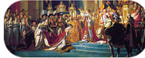
Le Sacre de Napoléon

En 1804, il se fait couronner empereur des Français sous le nom de Napoléon I er .