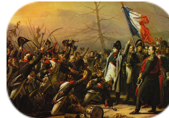
Le ralliement des soldats à Napoléon

Le roi Louis XVIII qui a pris la place de Napoléon n'est pas aimé. Après 10 mois sur l'île d'Elbe, Napoléon débarque en secret en France. Les gens l'acclament et les soldats se rangent sous ses ordres. C'est un triomphe. Mais en réaction les Anglais, les Autrichiens, les Prussiens et les Russes lui déclarent une nouvelle fois la guerre. La grande bataille a lieu à Waterloo en 1815. L'armée française est écrasée. On aura appelé ce bref retour au pouvoir de Napoléon la période des Cent-jours .