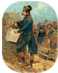
Napoléon au siège de Toulon

En 1793, il part sur le continent et il est nommé chef de l'artillerie dans l'armée républicaine qui assiège Toulon (contre les Britanniques). Son brillant succès le fait remarquer et il est alors nommé général à seulement 24 ans.