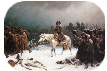
Napoléon pendant la campagne de Russie

En 1812, Napoléon attaque la Russie . Mais à cause de l'hiver, 400 000 soldats perdent la vie. Les armées étrangères vont envahir la France. En 1814, Napoléon est obligé d' abdiquer . Il est envoyé en exil sur l' île d'Elbe .