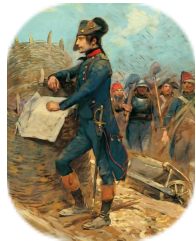
Napoléon au siège de Toulon

En 1793, il part sur le continent et il est nommé chef de l'artillerie dans l'armée républicaine qui assiège Toulon (contre les Britanniques). Son brillant succès le fait remarquer et il est alors nommé général à seulement 24 ans.