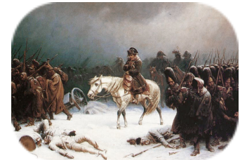
Napoléon pendant la campagne de Russie

En 1812, Napoléon attaque la Russie . Mais à cause de l'hiver, 400 000 soldats perdent la vie. Les armées étrangères vont envahir la France. En 1814, Napoléon est obligé d' abdiquer . Il est envoyé en exil sur l' île d'Elbe .