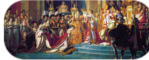
Le Sacre de Napoléon

En 1804, il se fait couronner empereur des Français sous le nom de Napoléon I er .