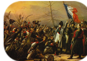
Le ralliement des soldats à Napoléon

Le roi Louis XVIII qui a pris la place de Napoléon n'est pas aimé. Après 10 mois sur l'île d'Elbe, Napoléon débarque en secret en France. Les gens l'acclament et les soldats se rangent sous ses ordres. C'est un triomphe. Mais en réaction les Anglais, les Autrichiens, les Prussiens et les Russes lui déclarent une nouvelle fois la guerre. La grande bataille a lieu à Waterloo en 1815. L'armée française est écrasée. On aura appelé ce bref retour au pouvoir de Napoléon la période des Cent-jours .